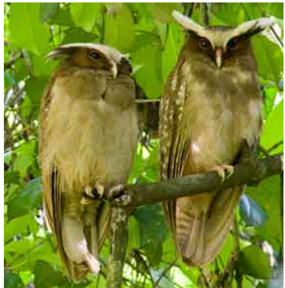
Riqueza ecológica en el área amazónica de Yasuní. Búhos ( Lophotrix cristata , de la Familia Strigidae). Estación de Biodiversidad Tiputini de la USFQ -Yasuni/Ecuador.

El pensamiento convencional se limita a hacer de los bienes y servicios elementos transables, a través de la dotación de derechos de propiedad, pero no incorpora esa noción de límites. Sin embargo, se ha acumulado mucha información acerca de las consecuencias del sobre uso de los recursos naturales y las capacidades de los ecosistemas y el planeta de amortiguar los impactos. Esta es una situación que se produce debido a la generalización de un comportamiento egoísta, incapaz de reconocer que un recurso tiene un límite o umbral antes de colapsar.